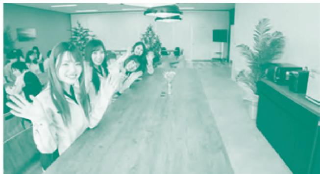
可能性を拓げる若い世代