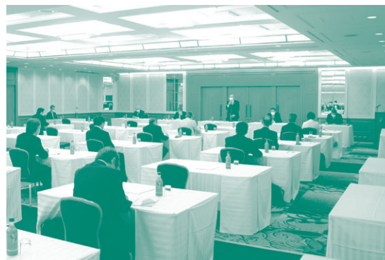
コロナウイルス感染拡大防止対策を取った総会会場

◆議案審議の後、2020年度の主な取組み説明と第7回産業論文コンクール審査結果発表を行い、第61回通常総会は滞りなく終了いたしました。